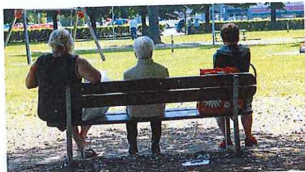
Luoghi di aggregazione In arrivo finanziamenti per rinnovare villaggi